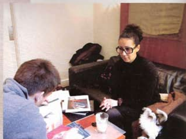
10.10: Er til møde på kaffebar om sin næste bog.